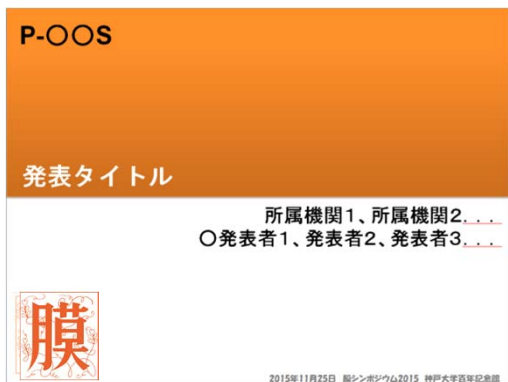
タイトルページ (事務局で作成)

パワーポイントのアニメーション機能や、動画ファイルなどは使用せず、発表時の画面は静止状態となるようにしてください。